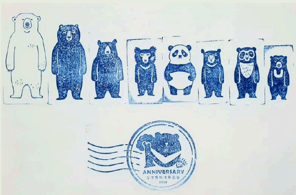
台灣黑熊保育協會擺攤宣傳之印章

看完這部紀錄片後，我覺得研究人員如此的努力想保住這隻黑熊，最後還是遭遇不測很惋惜，也認為政令宣導可以再加強，政府需要努力取得獵人們的信任。雖然獵人是害怕自己受法律制裁將黑熊殺害，可以說是自私的一種行為， 但我不會想要指責獵人 ，他們正是害怕別人的指責而有此行徑，而是會 想藉這個故事告訴更多人 ， 誤捕到保育動物其實不需感到害怕 ，甚至通報可以得到獎金。影片中也有出現尋熊記的作者黃美秀，看完這部紀錄片更能理解作者的心境，看著黑熊被人物傷的無助、想要幫助也要小心謹慎，救援動物真的很不容易。